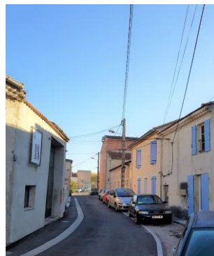
Cabannes, Rue des Bourgades