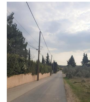
Maussane-les-Alpilles/Le Paradou, Chemin du Touret